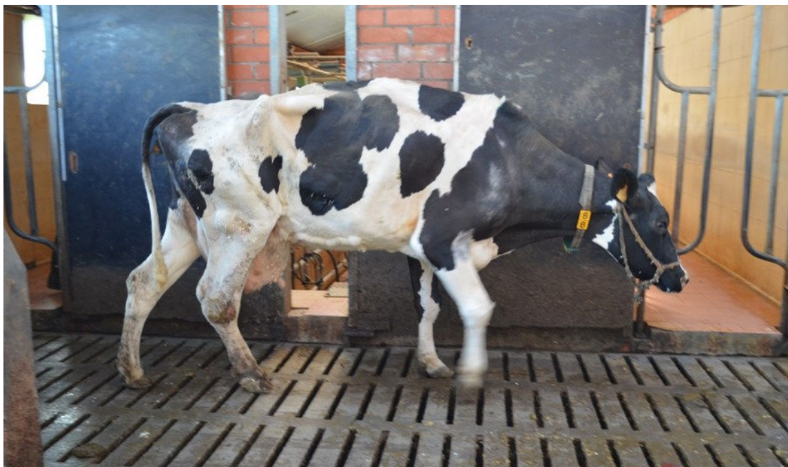
Figuur 1: Deze typische chronisch manke koe vertoont veel kenmerken van erge kreupelheid: zeer mager, dikke hakken, kromme rug bij staan en voortbewegen, kop laag gehouden,...

Er zijn heel wat scoresystemen in omloop om de mobiliteit van koeien te beoordelen. Meestal wordt de mobiliteit beoordeeld aan de hand van een vijfpuntsschaal. Figuur 2 geeft op een schematische wijze een mogelijk beoordelingssysteem weer. In Bijlage 1 kan je de visuele versie van dit systeem vinden. Score 1 en 2 worden als goed beschouwd. Een koe met score 3 is licht kreupel, terwijl score 4 en 5 respectievelijk kreupel en ernstig kreupel