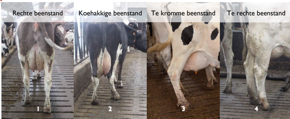
Figuur 3: Voorbeelden van een goede (1) en een slechte (2-4) beenstanden in achteraanzicht en zijaanzicht.