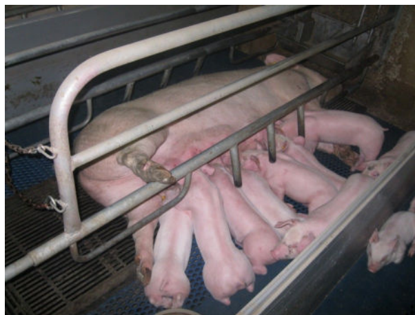
Figuur 3: Een zeug met haar biggen (Foto: D&W beeldbank).

- Houd rekening met de bedrijfseigen situatie: vroeg spenen kan op een ander bedrijf geen problemen opleveren, maar op het eigen bedrijf mogelijk wel omwille van bedrijfseigen beïnvloedende factoren.