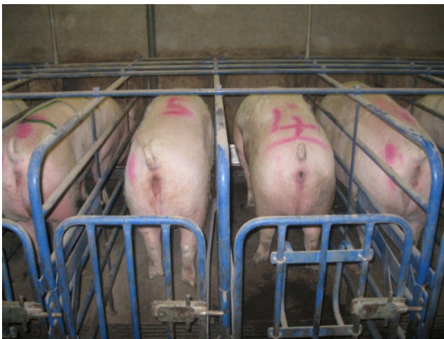
Figuur 1: De speenleeftijd en bijgevolg lactatieduur oefenen een invloed uit op het interval tussen spenen en dekken.

Voor de varkenshouder is het economisch interessant om het interval spenen - dekken (insemineren) zo kort mogelijk te houden. Hoe sneller de zeug opnieuw kan worden gedekt, hoe meer worpen ze kan voortbrengen. Onderzoek naar het verband tussen drachtpercentage en het spenen - dekken interval (SDI) heeft aangetoond dat als dit interval tussen 0 en 6 dagen ligt, er sprake is van een hoger drachtpercentage en een hogere worpgrootte dan als dit interval tussen 7 en 12 dagen ligt. Men spreekt hier dan ook over een hoog- en laagproductieve periode. Het blijkt dus beter te zijn voor de productieresultaten dat het SDI zich tussen 0 en 6 dagen bevindt. Daarnaast werd aangetoond dat zeugen die vroeg worden gespeend (14 dagen), een verhoogd risico lopen om pas tussen 7 en 12 dagen na het spenen worden gedekt (en dus in de laagproductieve periode), ten opzichte van zeugen die later worden gespeend (19 dagen). Te vroeg spenen kan er dus toe leiden dat de zeug in de laagproductieve periode wordt gedekt, waardoor de kans groter wordt dat ze niet meteen drachtig zal zijn.